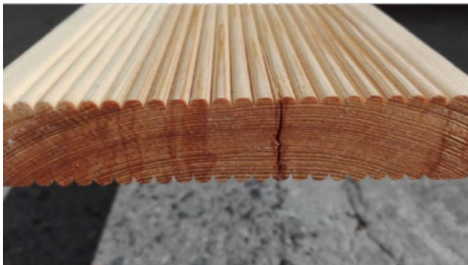
Primer čevone pukotine na ekstra klasi