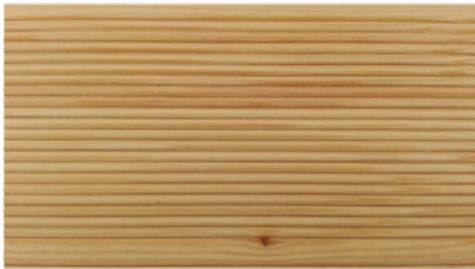
Primer čvora na ekstra klasi