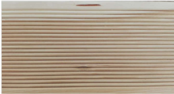
Primer smolnog džepa na ekstra klasi